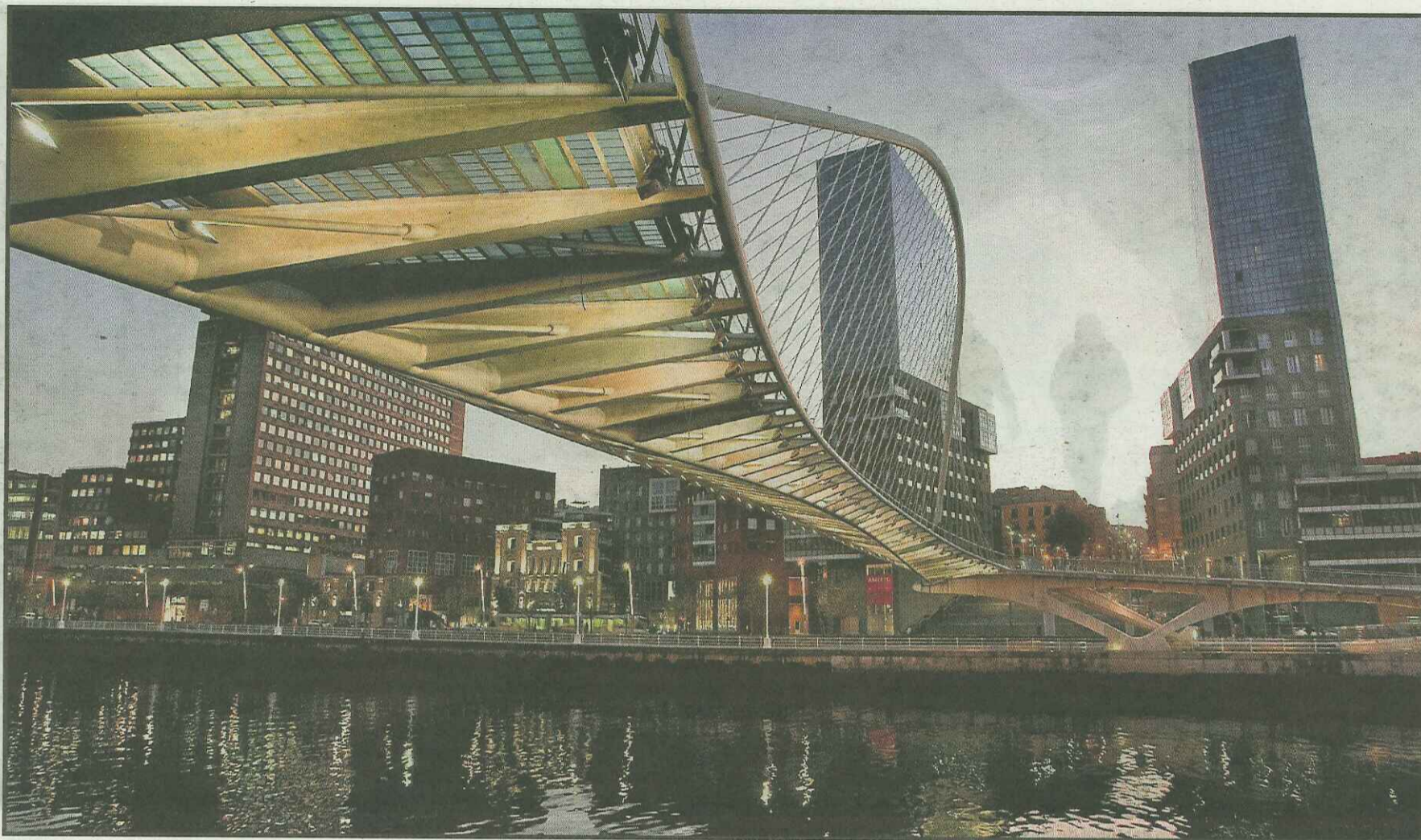
Vista de uno de los emblemas de la capital vizcaína, el Puente de Calatrava con las torres de Isozaki al fondo.